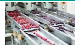
食品製造ラインのフリーザー