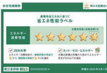
省エネ性能の表示